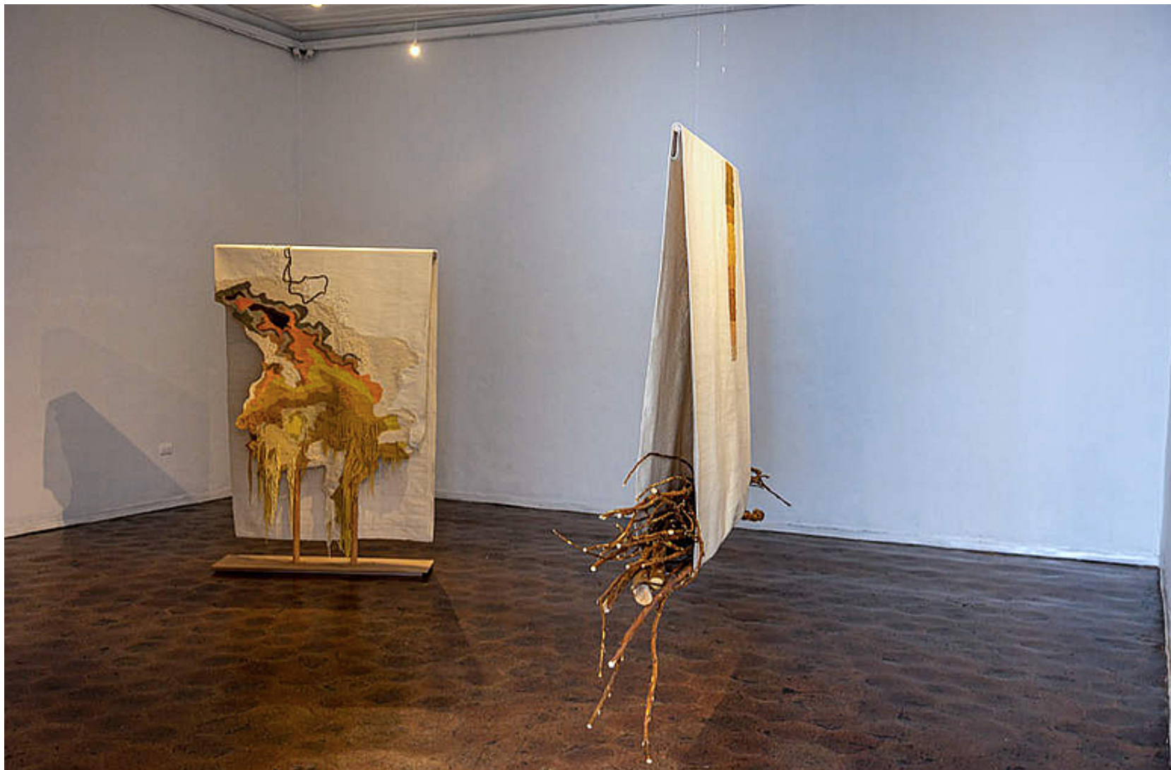
Bienal de Cuenca. Ecuador. Comisaria Blanca de la Torre