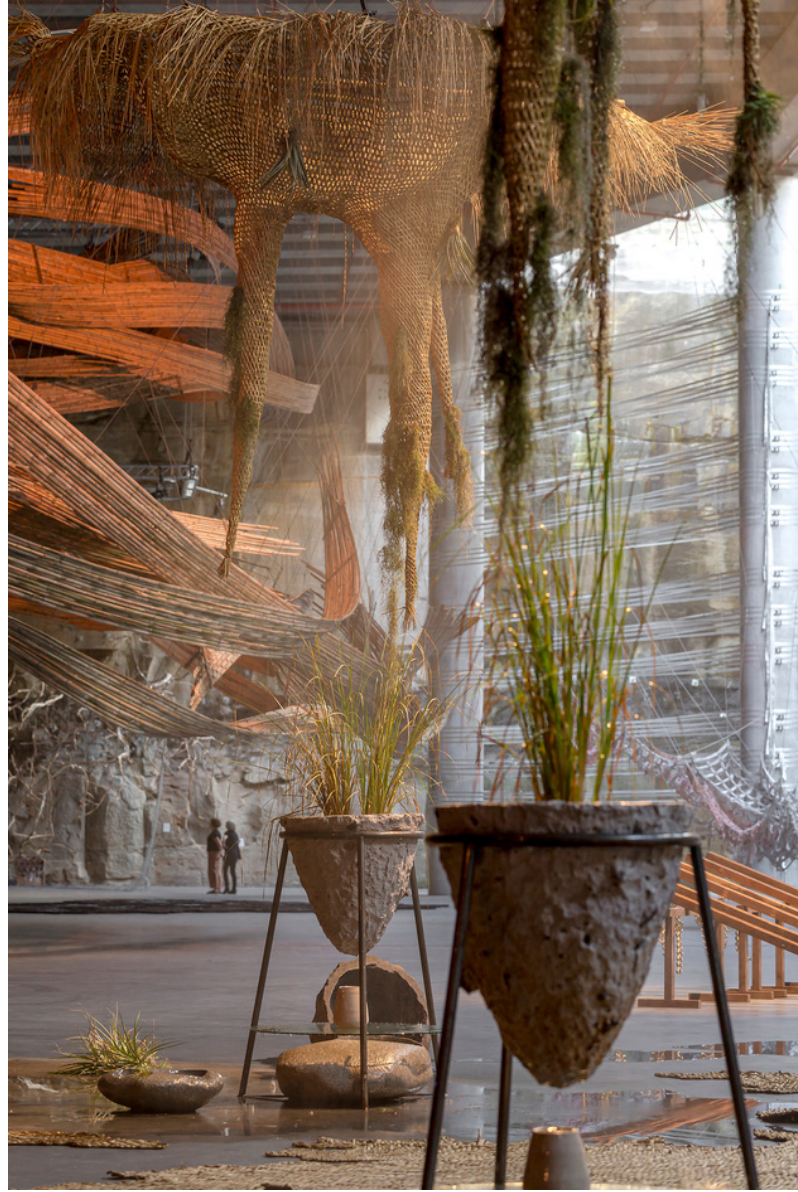
Bienal de Sydney