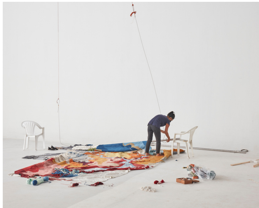
Obra comisionada para empresa de Peru