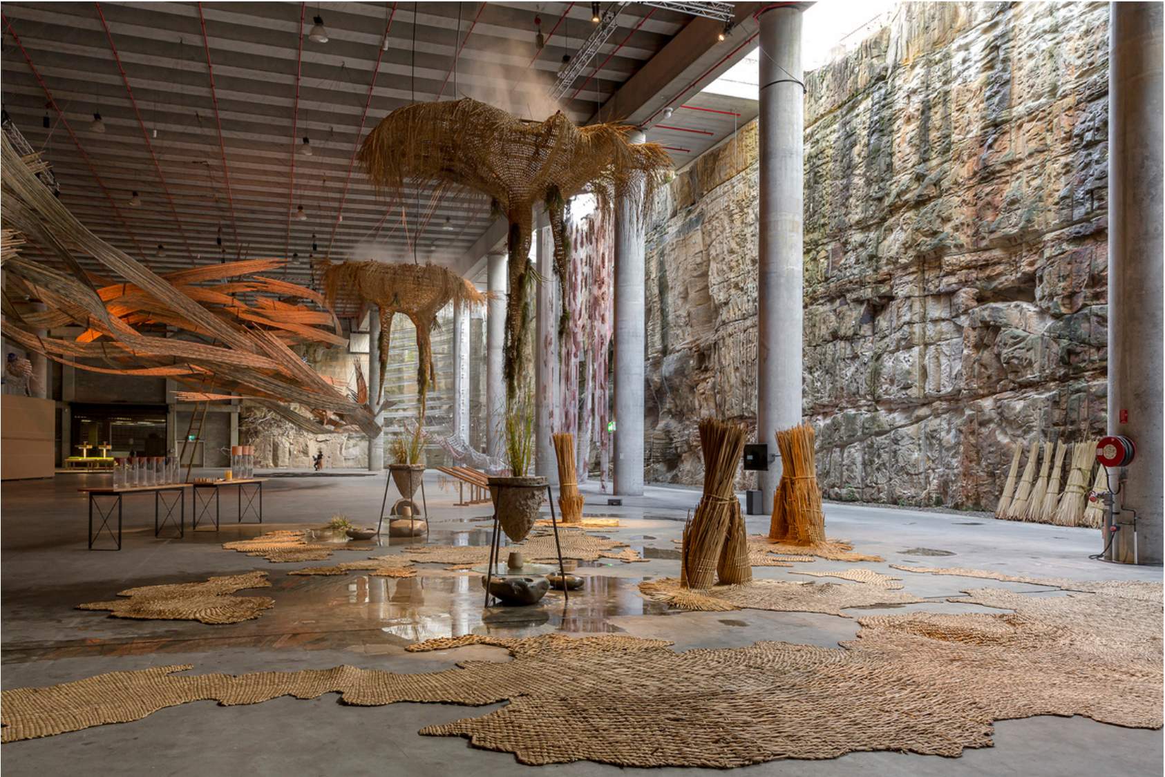
Bienal de Sydney. Australia