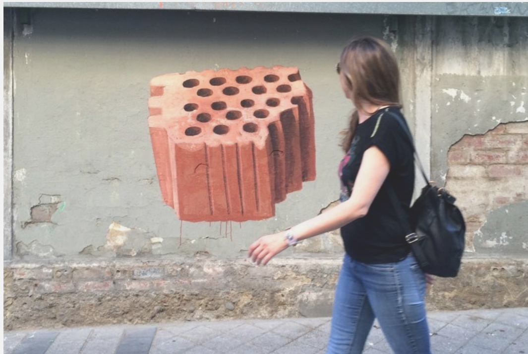
Ignacio Pérez-Jofre. Intervención urbana en Valladolid (2015). Acrílico sobre muro

Su obra está presente en colecciones públicas como la del Centro Galego de Arte Contemporánea, Universidad de Salamanca, el Ayuntamiento de Salou, la Diputación de Orense, Diputación de Córdoba o el Palacio de Exposiciones y Congresos de Madrid.