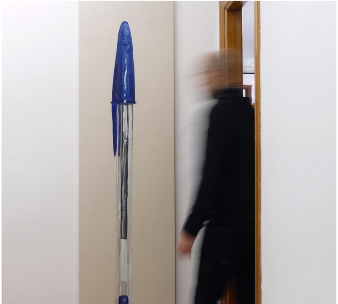
Ignacio Pérez-Jofre, "Artista adolescente". 2018. Acrílico sobre papel encolado a tela. 185x53 cm