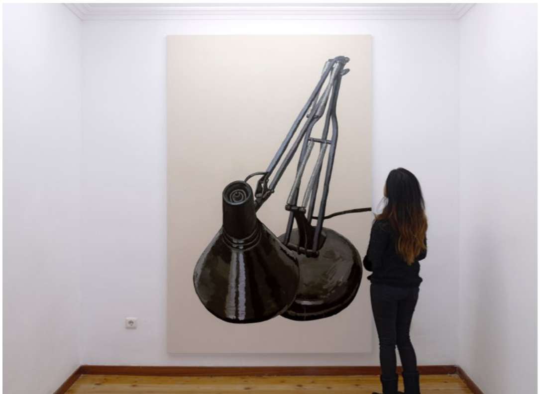
Ignacio Pérez-Jofre, "Sumisión". 2018. Acrílico sobre papel encolado a tela. 235x150 cm

Junto a ellos, cinco cuadros de gran formato representan otros tantos de esos objetos (zapatos, un flexo, un lápiz o un bolígrafo...) que han adquirido "importancia creciente en su pensamiento" según sus palabras y en cierto modo, por su presencia y los títulos que les da, el carácter de personajes , ocupan de manera casi violenta varias paredes de la vivienda en que se ubica la galería. Cuadros que Pérez-Jofre pinta –también del natural, sin mediación fotográfica– con trazo enérgico sobre papel de gran formato que después siluetea y pega sobre un lienzo crudo; lo que crea un sorprendente contraste entre la pincelada expresiva y el borde preciso y delimitado recortado contra el fondo impoluto.