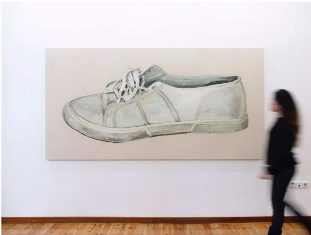
Ignacio Pérez-Jofre, "Viuda". 2018. Acrílico sobre papel encolado a tela. 130x250 cm