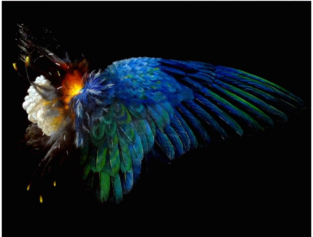
Paloma Pájaro. "Zoosofías" (10), 2017. Pintura acrílica y lápices de color sobre tabla. 22x35 cm

Por otro lado, Paloma Pájaro , también se sirve de la iconografía animal como pretexto desde el que reflexionar sobre cuestiones de corte filosófico, especialmente aquellos movimientos que transforman las estructuras psicofísicas del sujeto humano. Con su serie "Zoosofías" (2017-2018) realiza, desde la práctica artística, un análisis crítico sobre el necesario descentramiento del ego humano en favor de la supervivencia de la vida animal o natural. Así, con una técnica fundamentalmente pictórica, concibe obras de corte realista trabajando sobre tabla y en formatos muy variados, piezas que se podrán ver el próximo mes de mayo en la galería vallisoletana bajo el título "Zoosofías", la segunda muestra individual de Paloma Pájaro en la ciudad tras su exposición en Las Cortes de Castilla y León durante este 2018.