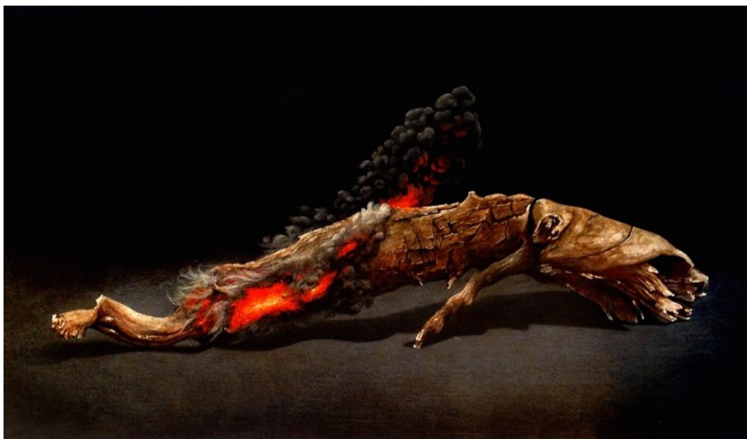
Paloma Pájaro. “Es lo bajo por oposición a lo alto nº2”, 2017. Pintura acrílica y lápices de color sobre tabla. 23x41 cm.

Junto a su trabajo artístico, también se dedica a la gestión cultural y el comisariado con proyectos como “Dead at Home” en Salamanca, llevado a cabo anualmente desde 2014 hasta 2017 en Salamanca o el Festival PANANDEROS, industria y cultura contemporánea” de la misma ciudad (2008) o la gestión de su propia galería entre el 2000 y el 2002.