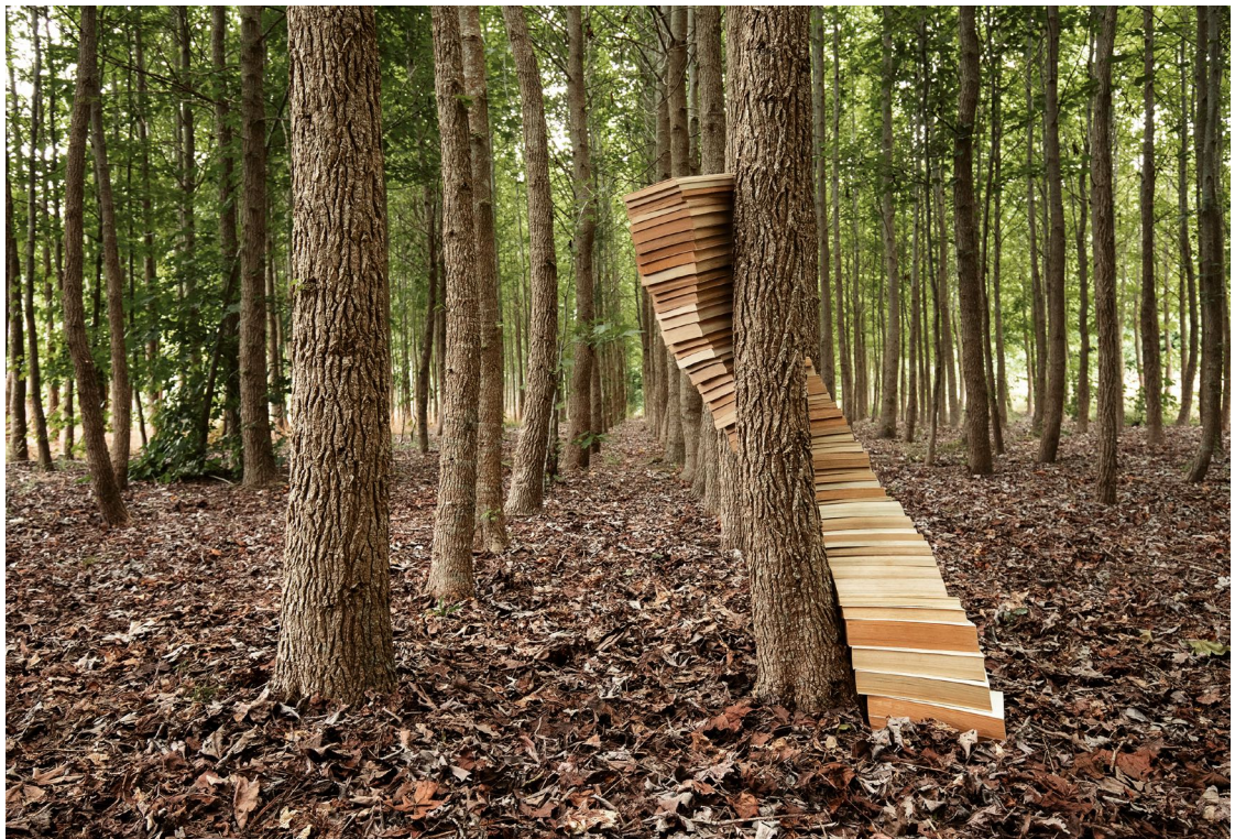
Verónica Vicente, "Escrito en las hojas, 6", 2019. Impresión con tintas pigmentadas sobre papel algodón. 107x150 cm

Ifema Feria de Madrid. Pabellón 1. De jueves 17 a domingo 20 de octubre, de 12 a 21 h.