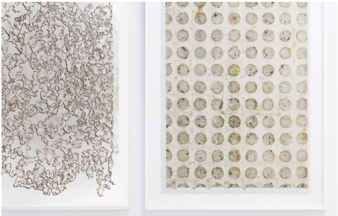
Ignacio Pérez-Jofre, “Suelo”, 2019. Suciedad y erosión sobre papel. 84x59 cm

En las obras de la serie “Suelo” de Ignacio Pérez-Jofre, además de la colaboración anónima, colectiva e inconsciente de quienes transitan sobre los papeles que el artista ha depositado en la calzada rompiendo su blanco inmaculado con los residuos que la ciudad va acumulando en sus calles, hay un elemento temporal y procesual muy intenso en ese dejar que la pieza se haga sola; a veces en pocas horas, otras en varios días. Por último, Alfredo e Isabel Aquilizan aluden en los “Fragmentos” que presentamos, como en el resto de sus instalaciones, al desplazamiento, al desarraigo y al hogar de origen. Es un trabajo claramente procesual que crece en el transcurso de cada exposición, se desmonta y vuelve a montar en otro sitio; en un proyecto nómada que cambia con el decurso de los años, como las ciudades frágiles de las que provienen ellos y quienes colaboran en su construcción.