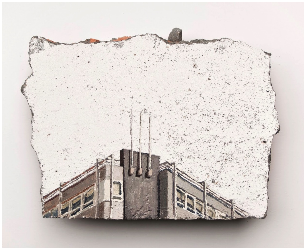
Escombros, (García Barbón / Colón I), 2014. Óleo sobre yeso, cemento y ladrillo. 20 x 28 cm

Ignacio Pérez-Jofre inaugura "Escombros" en La Gran, su primera exposición individual en Valladolid, que incluye varias intervenciones en fachadas de lugares céntricos de la ciudad