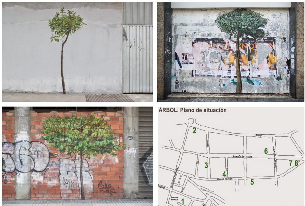
Diversas imágenes de Árbol , realizado en Vigo

Ignacio Pérez-Jofre (Madrid, 1965) es licenciado y doctor en Bellas Artes y Profesor Titular en la Facultad de Bellas Artes de Pontevedra. Su trabajo como artista está centrado en la observación y descripción de lo visible, buscando ser muy concreto. Se identifica con la idea de cotidianidad: cosas, gente y lugares de su entorno cercano se convierten en motivo de reflexión y contemplación.