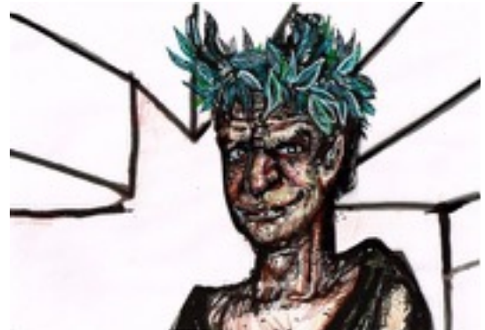
Enrique Marty " All your world is pointless ", 2014. Dibujo y collage sobre papel. 22 x 32 cm c/u.