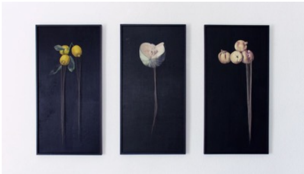
"Sin título (siniestro)", 1992, óleo y pelo sobre lino montado en tabla. Tríptico. 80x40 cm cada uno