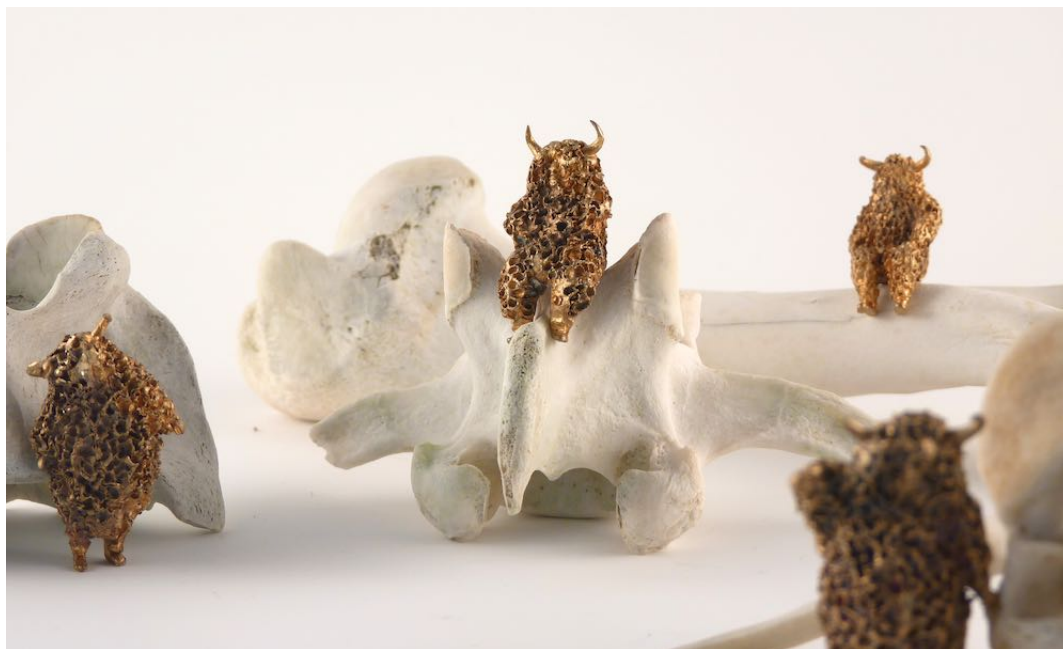
Laura Salguero. "Carne levare" (detalle), 2014. Colección de 9 esculturas de bronce y 8 huesos. 50 x 50 x 40 cm