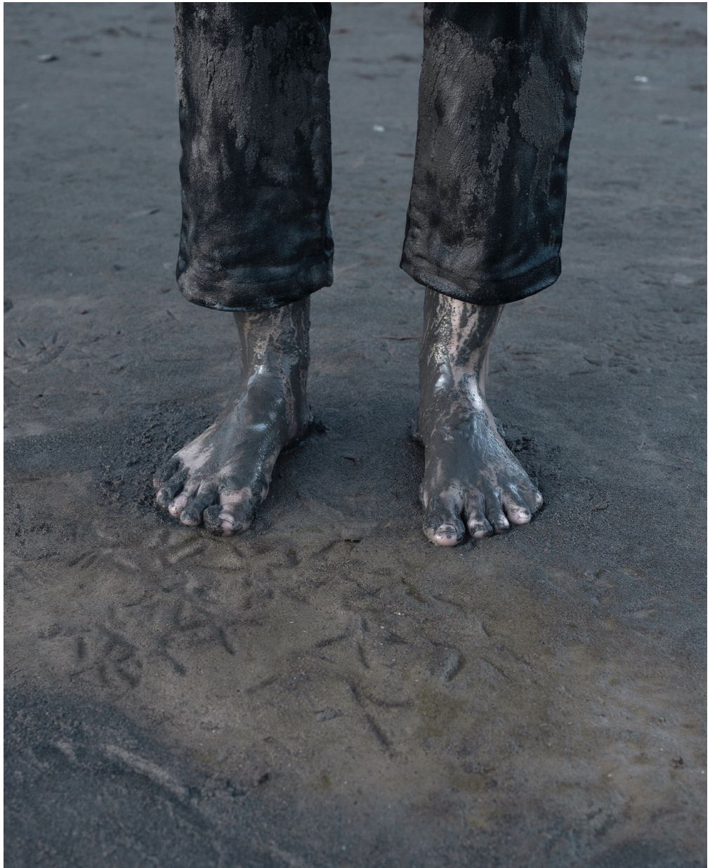
Moreno & Grau, “Equilibrio”, Fotografía impresa en Papel Agave de Hanhemulhe, 79x62 cm. 2020

Siguiendo con nuestro ciclo sobre el paisaje, La Gran se complace en presentar “La Isla. (Arcilla. Amoniaco. Mosquito)”, una exposición de Moreno & Grau que parte de un proyecto en el que el dúo de artistas malagueñas han realizado una profunda investigación in situ sobre el entorno de la desembocadura del río Guadalhorce.