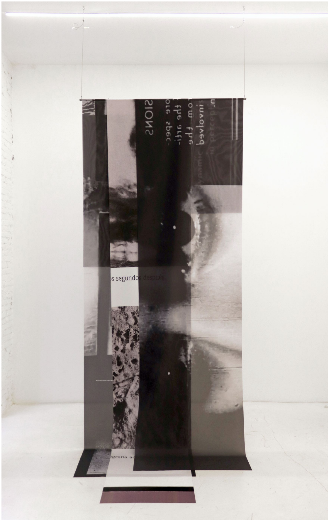
Ana Císcar. Sin título (de la serie The Act of Seeing With No Eyes ), 2020. Impresión digital sobre textil. 300x130x60 cm