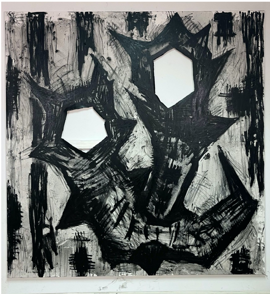
Black Butter. Casing Up , 2023. Acrílico, barra de óleo, spray y pigmento sobre lienzo. 195x190 cm