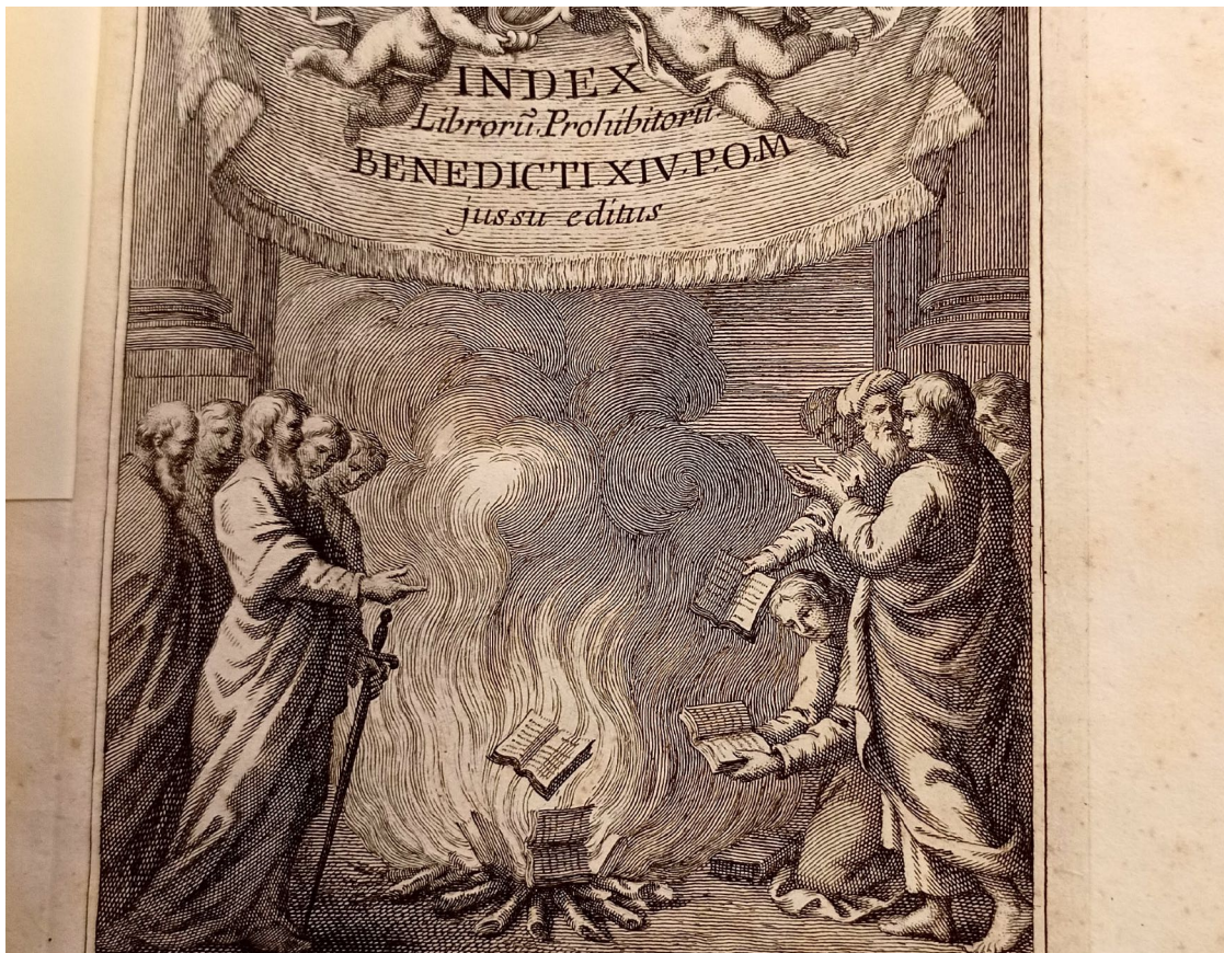
"Index Librorum prohibitorum". Portada con grabado sobre la quema de libros. Biblioteca Histórica Municipal del Ayuntamiento de Madrid

La Biblioteca Histórica Municipal del Ayuntamiento de Madrid conserva los fondos de la antigua Biblioteca Municipal, con más de 250.000 volúmenes de obras manuscritas e impresas entre los siglos XV y XXI. Entre las Colecciones Especiales cabe destacar la de Madrid, núcleo y origen de la Biblioteca, creada en 1876 a iniciativa de Ramón de Mesonero Romanos, y la de Teatro y Música escénica, cuyos fondos proceden en su mayor parte de los antiguos teatros madrileños de la Cruz y del Príncipe. Sus objetivos y funciones son los propios de una biblioteca especializada: la conservación, investigación y difusión de sus fondos.