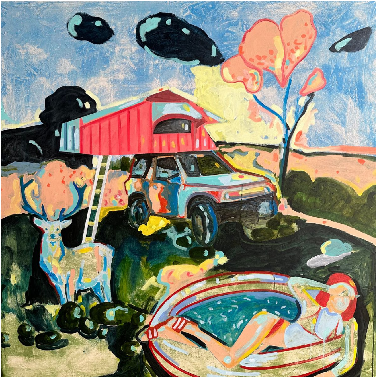
084 - De la serie Punchline Técnica mixta sobre lona 150 x 150 cm 2023 EUR €2,800+ iva